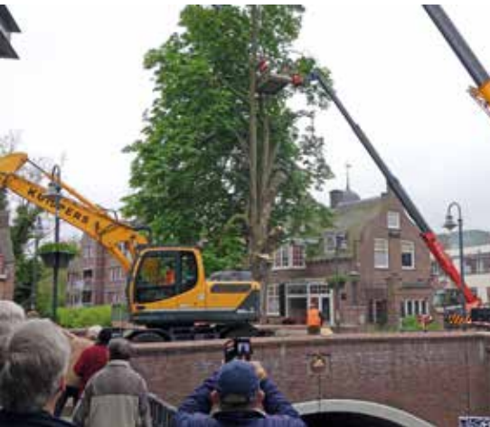
De oude kastanje wordt omgehaald