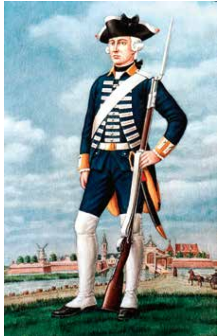
Soldaat Regiment Cronström

Door het stellen van inundaties waren de polders onbegaanbaar. De enige accessen of toegangen voor een vijand waren de dijken. Op die dijken werden aarden forten aangelegd, bewapend met enkele kanonnen. De forten hebben geen dienst gedaan en zijn daarna snel vervallen, maar de contouren zijn nog in het landschap zichtbaar.