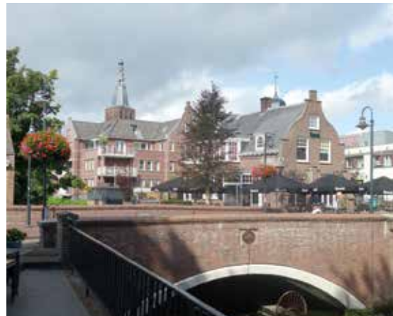
De jonge rode beuk op de plek bij de Dommelbrug