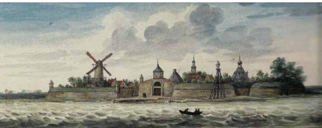
Willemstad 1867