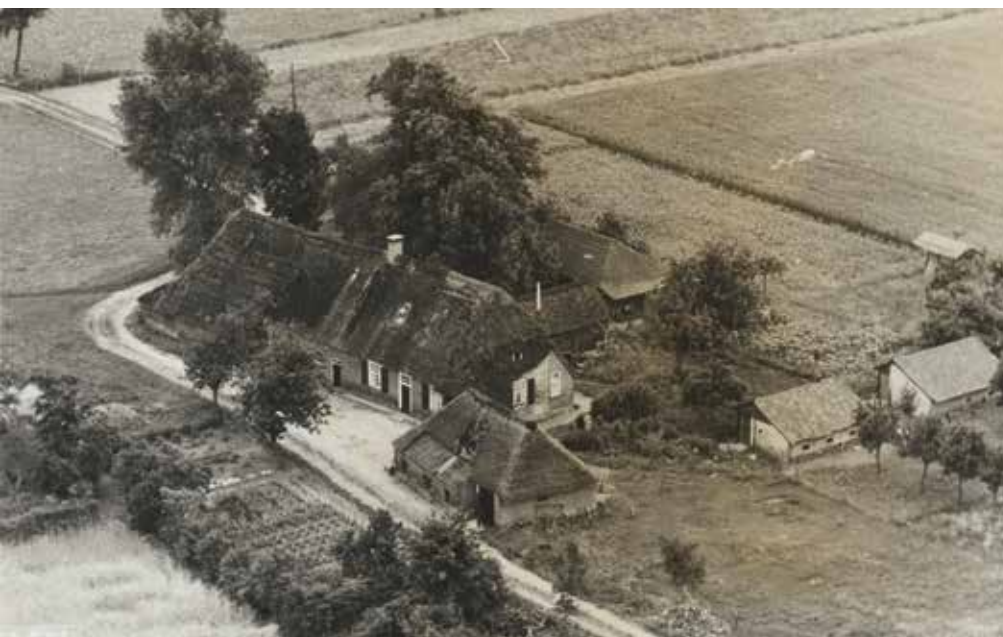
Boerderij De Duinhoeve in Udenhout

Het boek is een uitgave van het jubilerende (25 jaar) schrijversteam van ‘t Schoor en gaat over de vorming van het dorp Udenhout en Biezenmortel ten tijde van het hertogdom Brabant. Het is gelukt om vanuit de oude archieven de situatie van Udenhout en Biezenmortel van midden veertiende eeuw te reconstrueren. Na de stichting van Den Bosch, dat stadsrechten kreeg in 1184, en van Oisterwijk, dat in 1212 een vorm van stadsrechten kreeg, begon de hertog van Brabant vanaf 1232 steeds meer landerijen uit te geven aan particulieren en de abdij van Tongerlo om “het bos van Odenhout” ten westen van Oisterwijk in ontginning te nemen. Daarvoor werd een ontginningsweg aangelegd dwars door het dorp van west naar oost. Het dorp is in 1340 al groot genoeg om een molen te exploiteren. De kruising van de ge-