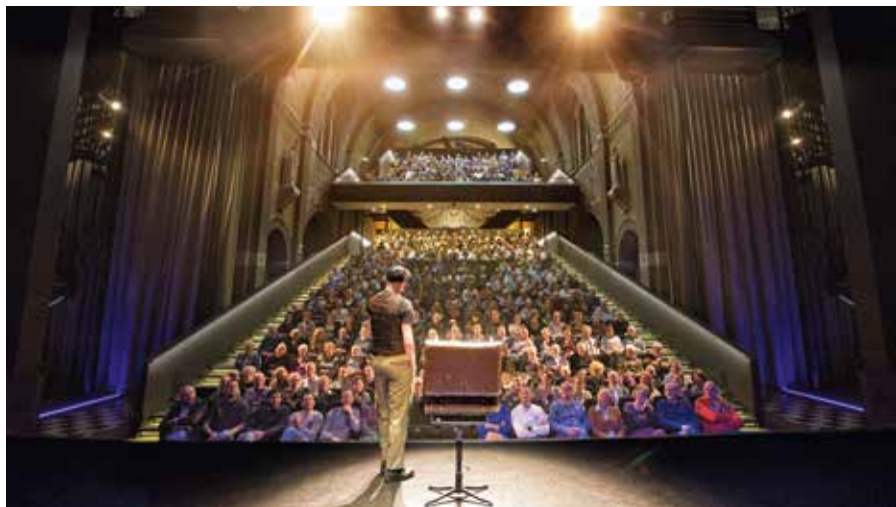
Een voorbeeld van een herbestemde kerk: Theater 't Speelhuis in Helmond, dat is ondergebracht in de Onze-Lieve-Vrouwekerk.

Bewustwording draagt bij aan het vinden van goede herbestemmingen van kerken die aan de eredienst zijn of worden onttrokken. Naar verwachting de helft van de 528 kerken in Noord-Brabant verliest in de komende tien jaar zijn oorspronkelijk functie. Het herbestemmen van kerken is het groot-